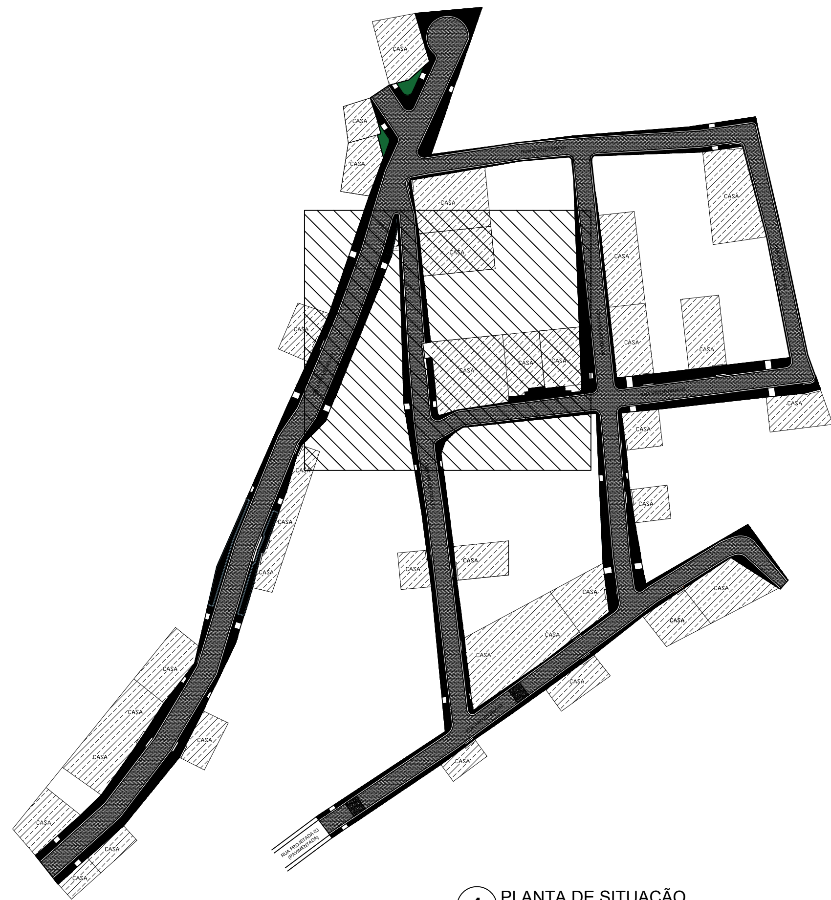
1 PLANTA DE SITUAÇÃO ESCALA 1/1000